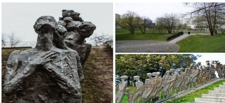
Яма (Минск, Беларусь)

Это один из первых памятников, установленных жертвам Холокоста. Первая часть мемориала «Яма» — площадка, вручную выложенная камнями — была открыта в 1947 на месте, где в 1942-м нацисты расстреляли 5 000 евреев.