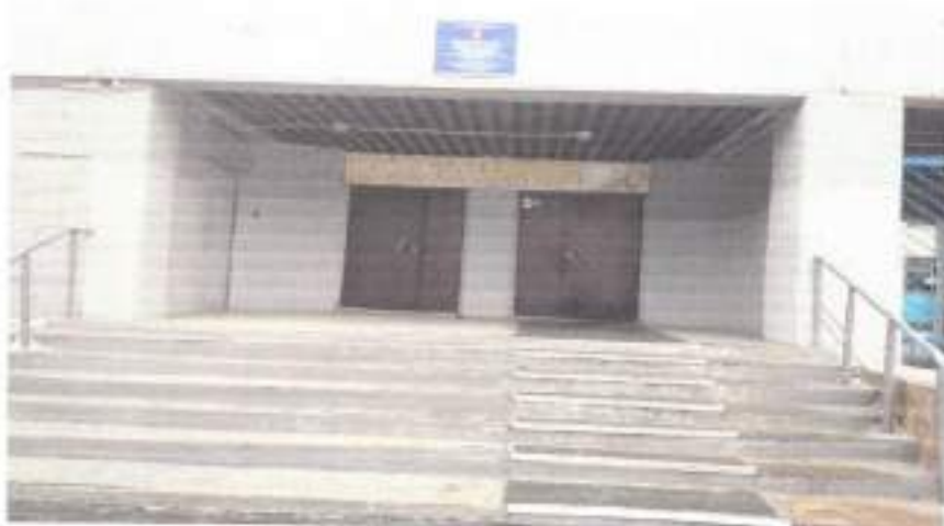
Вход в здание